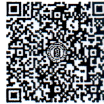
อัปโหลดไฟล์หลักฐานประกอบการสมัคร