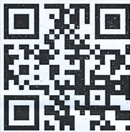
QR Code Link สมัครแข่งขัน Sirindhorn School Test 2024