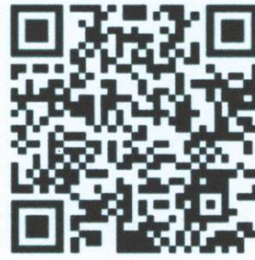
QR code คู่มือการอบรม