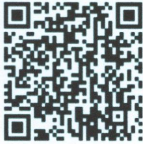
QR code ช่องทางการอบรม